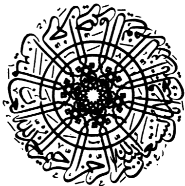
صورة الفاتحة بخط الثلث